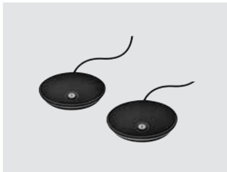
MICROFONI DI ESPANSIONE

Un sistema per videoconferenze straordinariamente economico per ambienti medio-grandi, in grado di trasformare qualunque sala riunioni in uno spazio di collaborazione video.