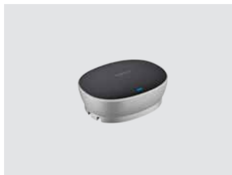
ΣΥΝΔΕΣΙΜΟΤΗΤΑ ΚΑΙ ΧΡΗΣΗ

Επεκτείνετε το πεδίο της συζήτησης από 6 m/20 πόδια σε 8,5 m/28 πόδια, ώστε να ακούγονται καθαρά ακόμη και όσοι βρίσκονται μακριά από το ηχείο ανοιχτής συνομιλίας. Τα μικρόφωνα διατίθενται σε ζεύγη και αναγνωρίζονται και ρυθμίζονται αυτόματα μόλις συνδεθούν στο ηχείο ανοιχτής συνομιλίας.